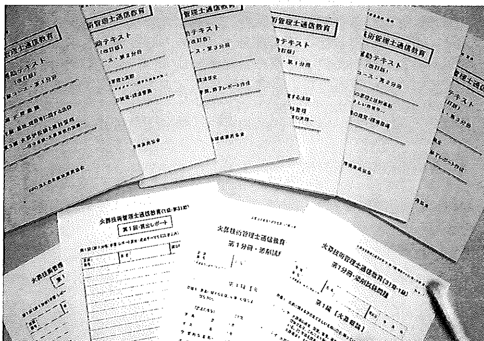
補助テキスト（改訂版）第1～3分冊、添削問題、レポート用紙（1級用・2級用）